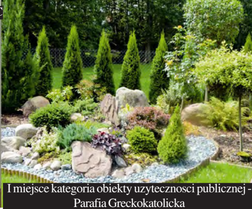
I miejsce kategoria obiekty użyteczności publicznej - Parafia Greckokatolicka