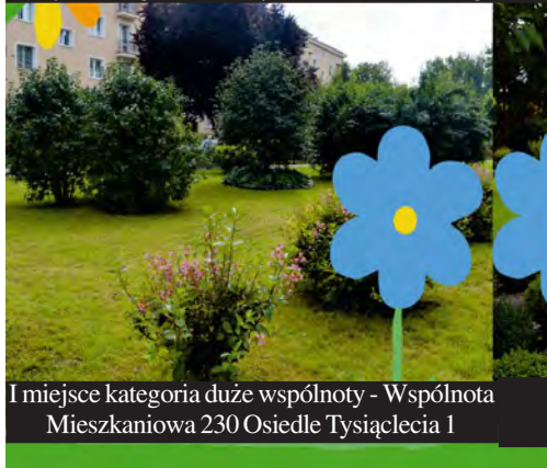
I miejsce kategoria duże wspólnoty - Wspólnota Mieszkaniowa 230 Osiedle Tysiąclecia 1