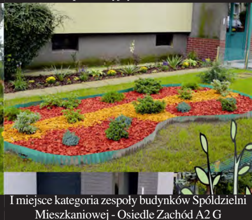
I miejsce kategoria zespoły budynków Spółdzielni Mieszkaniowej - Osiedle Zachód A2 G