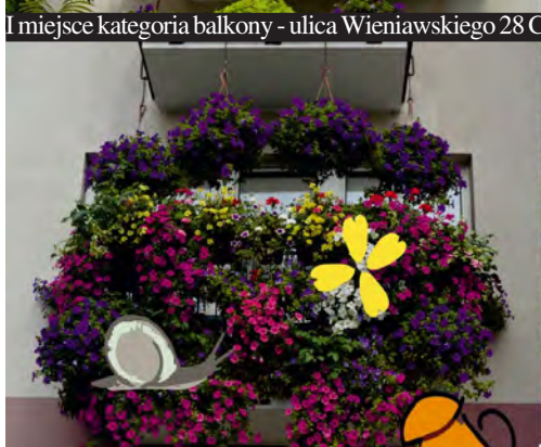
I miejsce kategoria balkony - ulica Wieniawskiego 28 C