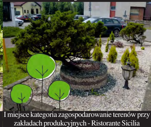
I miejsce kategoria zagospodarowanie terenów przy zakładach produkcyjnych - Ristorante Sicilia