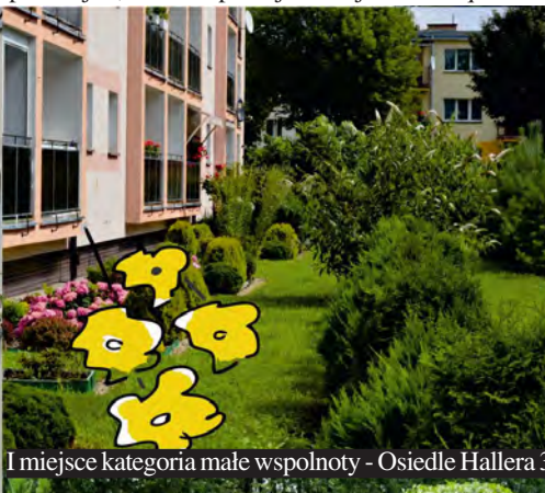
I miejsce kategoria małe wspólnoty - Osiedle Hallera 3