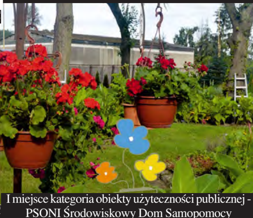
I miejsce kategoria obiekty użyteczności publicznej - PSONI Środowiskowy Dom Samopomocy