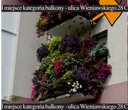
I miejsce kategoria balkony - ulica Wieniawskiego 28 C