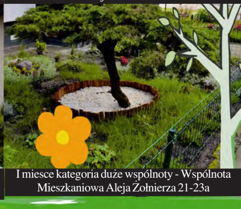
I miejsce kategoria duże wspólnoty - Wspólnota Mieszkaniowa Aleja Żołnierza 21-23a