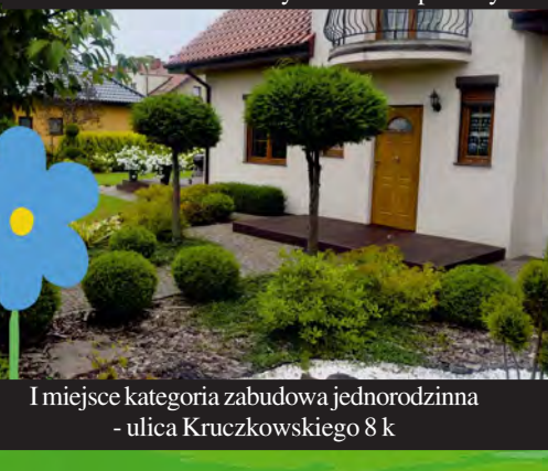
I miejsce kategoria zabudowa jednorodzinna - ulica Kruczkowskiego 8 k