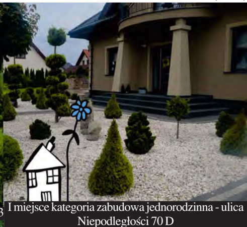
I miejsce kategoria zabudowa jednorodzinna - ulica Niepodległości 70 D