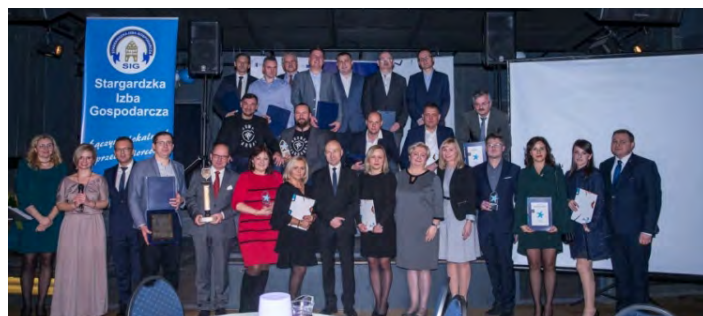
Laureaci nagrody za 2018 r

Rada Miejska jednogłośnie zdecydowała, że w przyszłym roku po raz pierwszy wręczona będzie nagroda im. Sławomira Pajora dla stargardzkiego przedsiębiorcy roku.