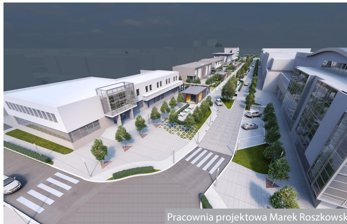
Pracownia projektowa Marek Roszkowski

Prace nad nowym planem były długie i złożone. Po uzyskaniu niezbędnych opinii i uzgodnień z projektem aktywnie zapoznawali się stargardzianie. Odbyła się szeroka, otwarta dyskusja publiczna, dzięki której mieszkańcy mieli możliwość przedstawienia swoich propozycji zmian. Wizualizacje odmienionej ul. S. Wyszyńskiego pochodzą ze zwycięskiej pracy w konkursie na opracowanie koncepcji urbanistyczno-architektonicznej dla tego obszaru.