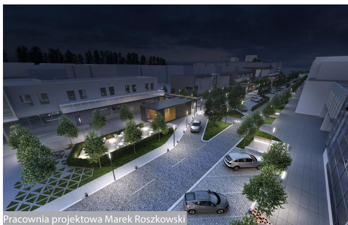
Pracownia projektowa Marek Roszkowski

– Plan zagospodarowania przestrzennego to ważny dokument. Zmiany w obszarze ul. S. Wyszyńskiego w połączeniu z placem Wolności i terenem przed SCK będą miały wpływ na funkcjonowanie miasta jako całości. Zakładamy, że w najbliższych latach może tam powstać szeroki deptak z prawdziwego zdarzenia, z dwoma ciągami gastronomicznymi – mówi prezydent Rafał Zając.