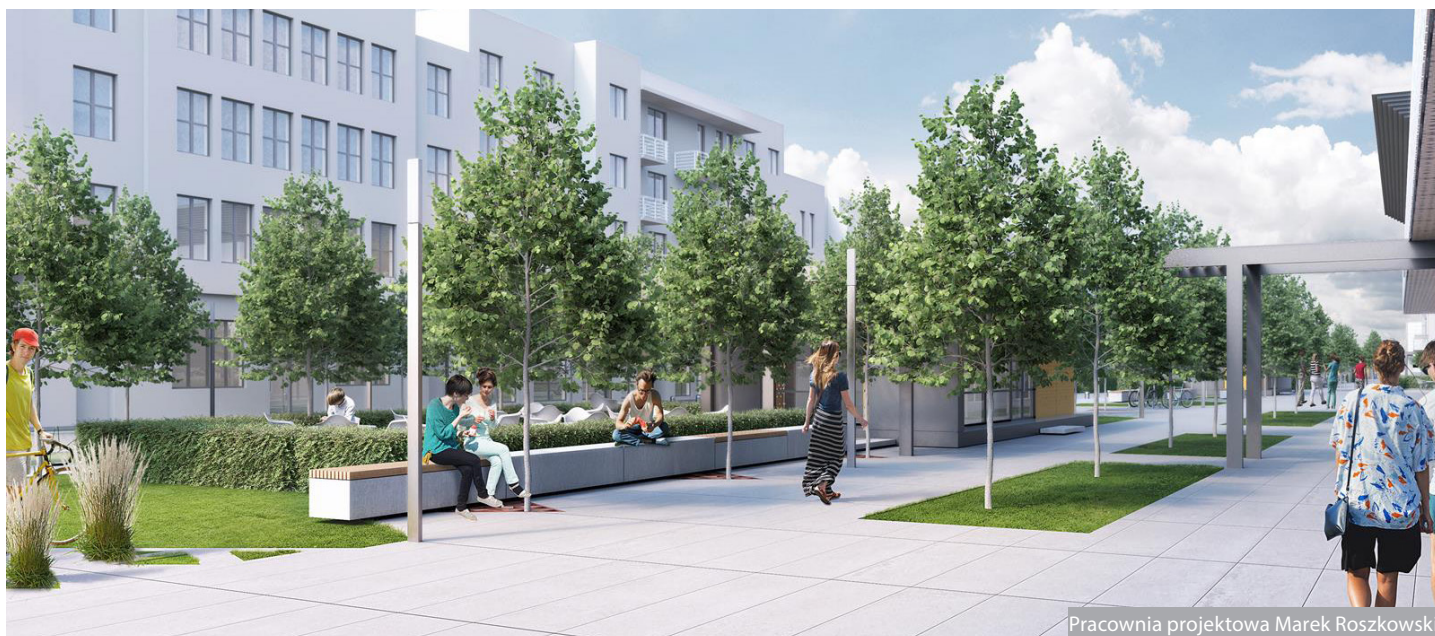
Pracownia projektowa Marek Roszkowski