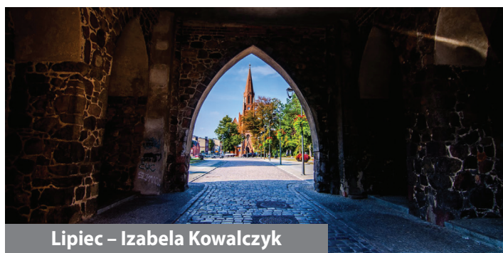
Lipiec – Izabela Kowalczyk