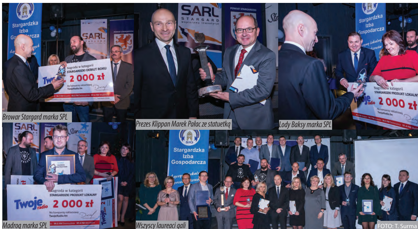
Browar Stargard marka SPL

- Stargard jest na fali wznoszącej i stale się rozwija. Jednak o ten rozwój wciąż musimy dbać. To proces, który wciąż się odbywa. Poprawiamy warunki funkcjonowania przedsiębiorców w PPNT, a także dostępność do rynku pracy. Dlatego szycujemy tak dużo zmian w transporcie publicznym, aby to wszystko zapewnić. Ogromnym wyzwaniem jest dla nas przyciąganie do Stargardu nowych mieszkańców. Będziemy zachęcać, żeby tu przyjechali i zameldowali się - powiedział prezydent. - Trzeba ich przekonać, że Stargard jest dobrym miejscem do pracy i życia.