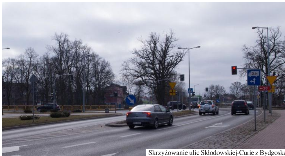
Skrzyżowanie ulic Skłodowskiej-Curie w Bydgoska