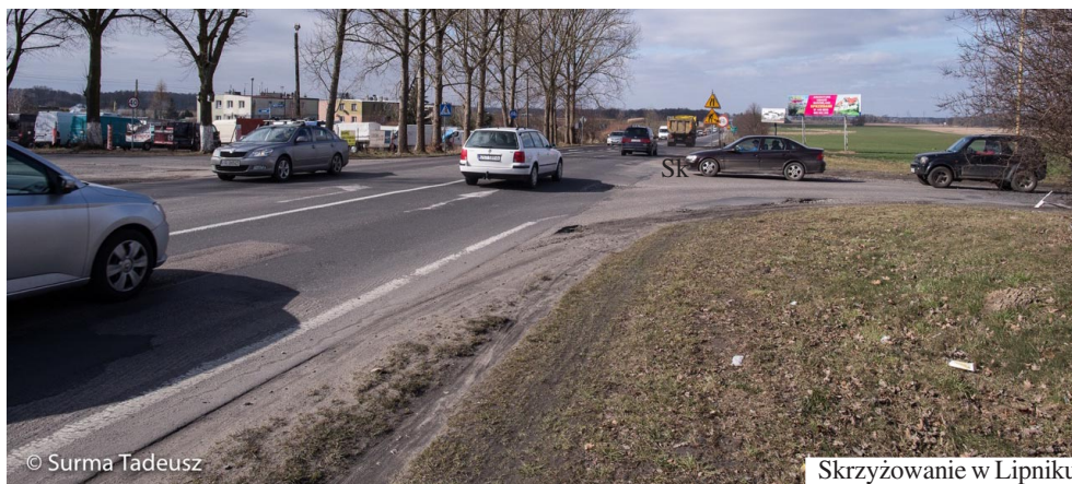
Skrzyżowanie w Lipniku

W Starostwie podpisana została umowa pomiędzy Powiatem Stargardzkim a Województwem Zachodniopomorskim na dofinansowanie przebudowy drogi od węzła Stargard Zachód drogi krajowej S10 do skrzyżowania z drogą gminną w miejscowości Lipnik wraz z przebudową skrzyżowania. To kolejna bardzo duża inwestycja w ramach infrastruktury dro-