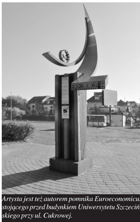
Artysta jest też autorem pomnika Euroeconomicus stojącego przed budynkiem Uniwersytetu Szczecińskiego przy ul. Cukrowej.

jekt uwzględni dostęp dla pieszych od strony ul. Kazimierza Wielkiego i ul. Marii Skłodowskiej-Curie. Lokalizacja dominaty od strony północnej gwarantuje dobrą ekspozycję od strony Starego Miasta oraz planowanego ronda. Jednocześnie zapewni właściwe oświetlenie elementów rzeźbiarskich i przestrzeni placu naturalnym