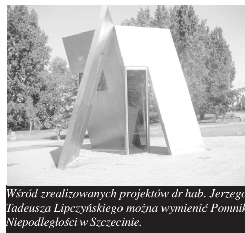
Wśród zrealizowanych projektów dr hab. Jerzego Tadeusza Lipczyńskiego można wymienić Pomnik Niepodległości w Szczecinie.

Stwierdzenie autorów w opisie: "Patriotyzm - droga do niepodległości" skupia uwagę na przeprowadzonej w projekcie koncepcję ideową "Drogi". Długa ścieżka projektowana na osi pomnika prowadzi widza do efektownego, pionowego elementu - symbolu "wniosłości idei niepodległości". Sama ścieżka i pozostałe horyzontalne for-