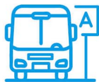
Transport i komunikacja