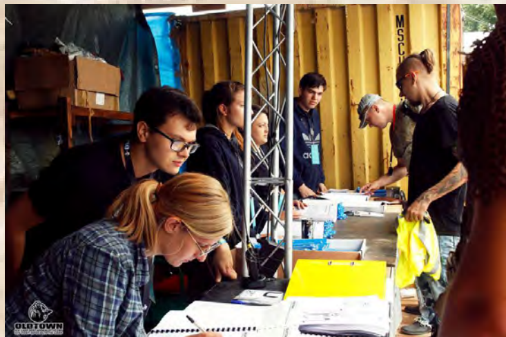
Niedziela, 15 lipca.

Niedziela to dla wielu z nas najintensywniejszy dzień OldTownu. Odwiedziło nas ponad dwudziestu Fotografów, aby porobić zdjęcia w ramach dorocznej olbrzymiej sesji zdjęciowej, OT Focus. Wpadli też inni Goście. Istnieje duże ryzyko, że w przyszłym roku cały Urząd Miasta Stargardu wylądował u nas na tygodniowym urlopie, tak im się tu spodobało i taki bezmiar możliwości dla rozwoju biurokracji tutaj zobaczyli... To może być prawdziwy TerrorOffice..