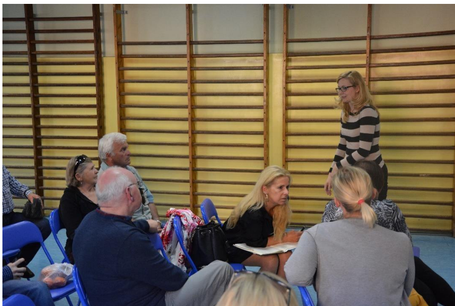
Mieszkańcy Obszaru Śródmieście - Starówka

W spotkaniu uczestniczyło 15 osób. Najpierw omówiono kwestie infrastruktury drogowej, stanu technicznego budynków, bezpieczeństwa, a następnie problemy społeczne, głównie zgłaszano uwagi dotyczące :