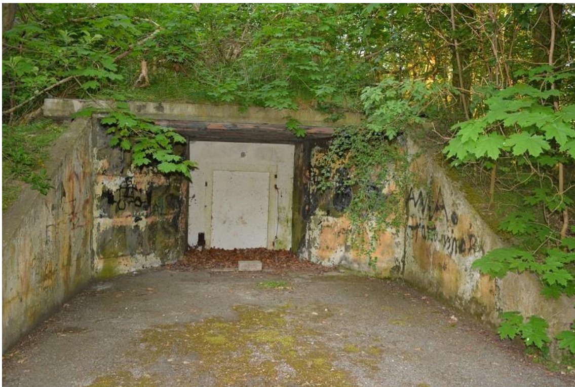
Opuszczony hangar poradziecki