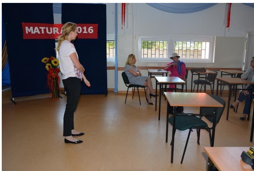
Spotkanie z mieszkańcami