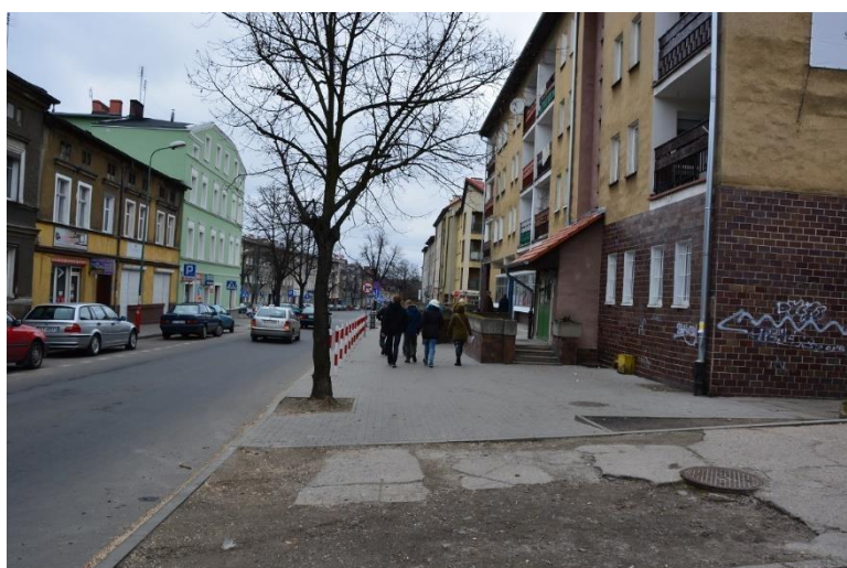
Uczestnicy Gry w terenie