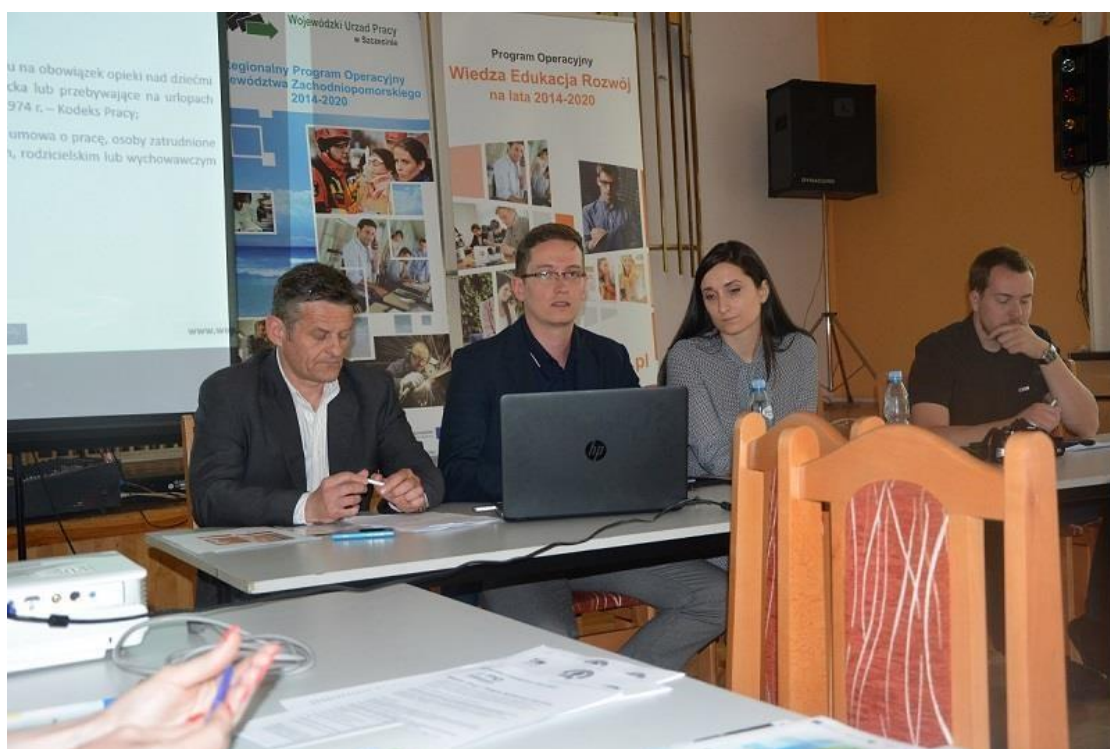
Przedstawiciele Wojewódzkiego Urzędu Pracy w Szczecinie oraz Urzędu Marszałkowskiego w Szczecinie