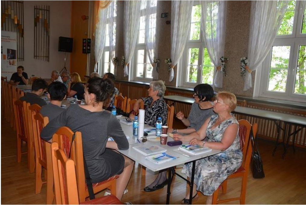
Uczestnicy spotkanie z organizacjami pozarządowymi