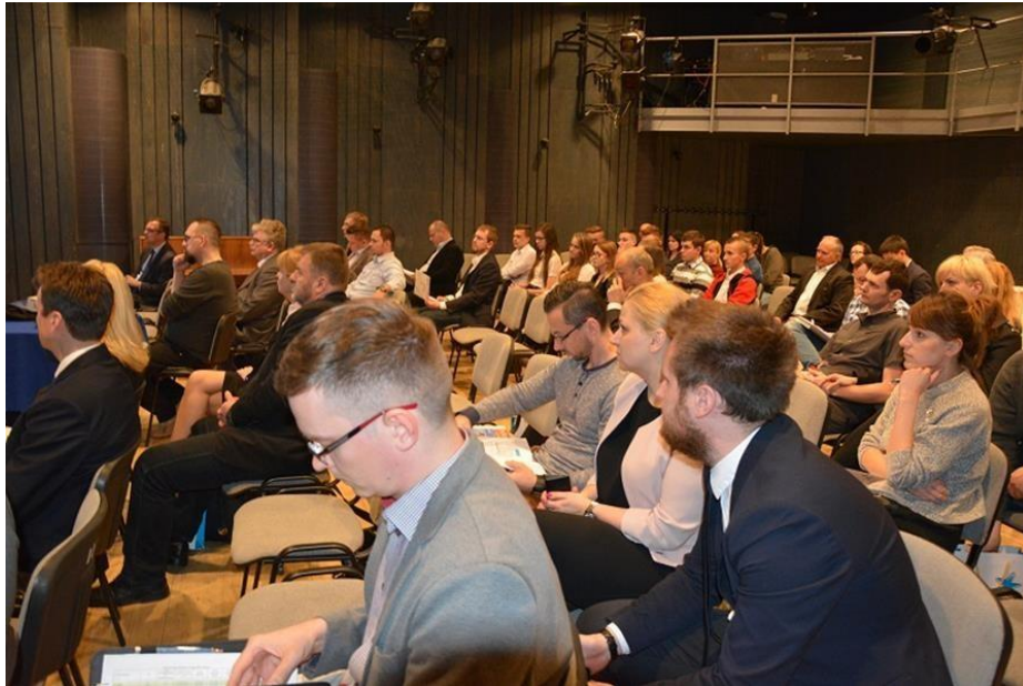
Uczestnicy konferencji dla przedsiębiorców

W konferencji udział wzięło 41 osób, przedsiębiorcy zwracali uwagę na zbyt trudny i przez to niejasny język, którym się posługują urzędnicy, jak również na zbyt skomplikowane procedury aplikacyjne i rozliczeniowe przez które muszą przejść, by uzyskać wsparcie na rozwój swoich przedsiębiorstw i firm, co często jest przyczyną, że nie korzystają z dofinansowań.