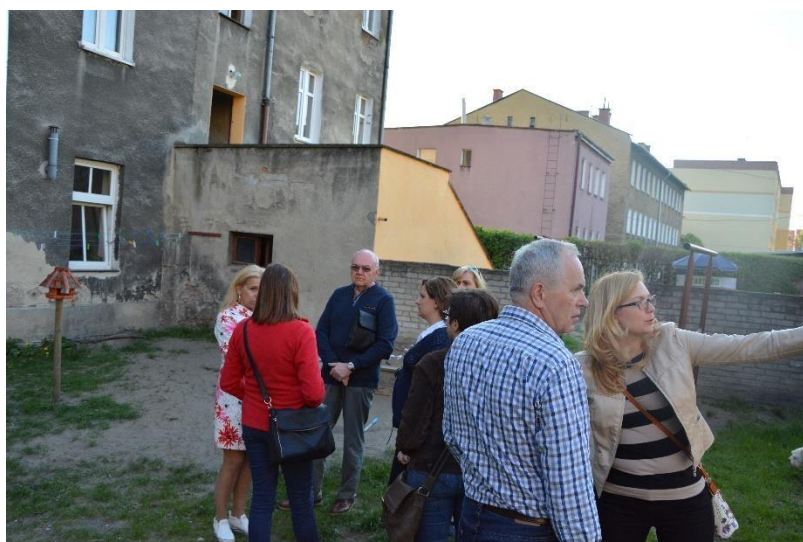
Spacer studyjny- ul. Wojska Polskiego