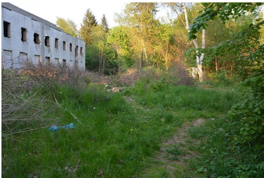
Zniszczona infrastruktura w parku na Osiedlu Lotnisko