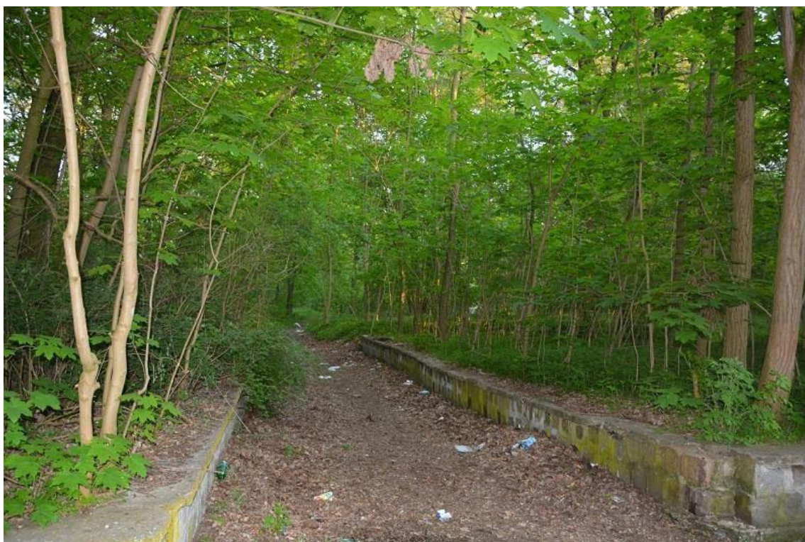
Park na Osiedlu Lotnisko