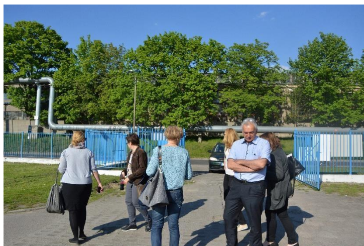
Spacer studyjny na obszarze Śródmieście-Zachód