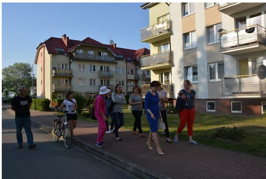
Uczestnicy spaceru studyjnego