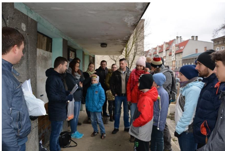
Uczestnicy Gry Miejskiej „W kamienicy dziurka – spójrz widać podwórka”