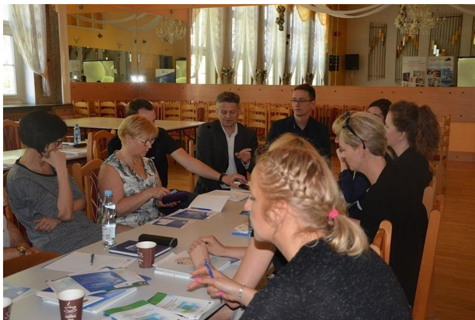
Warsztaty z przedstawicielami NGO