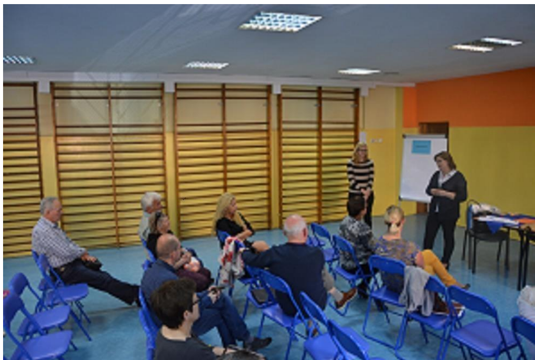
Mieszkańcy obszaru Śródmieście Starówka

Spotkanie odbyło się 5 maja 2016 roku o godz. 17.00 w Gimnazjum nr 2 przy ul. Bolesława Limanowskiego w Stargardzie. Prowadzone było przez przedstawicieli Urzędu Miejskiego w Stargardzie.