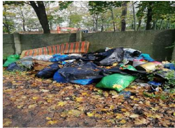
Fot. nr 3. Dzikie wysypisko zlokalizowane przy Rodzinnych Ogrodach Działkowych ul. Rolnicza

Na tereny miejskie, oddalone od zabudowań, na których zostały zlokalizowane „dzikie wysypiska” nieznanymi sprawcami porzucali nieznaczne ilości odpadów komunalnych (tj. odpady z tworzyw sztucznych, opakowania szklane, szkło, papier, folie, zużyte meble i odzież, zużyty sprzęt RTV i AGD). Na „dzikie wysypiska” trafiały także odpady pochodzące z drobnych remontów – gruz, niewykorzystane materiały budowlane oraz odpady zielone powstające podczas prac ogrodniczych.