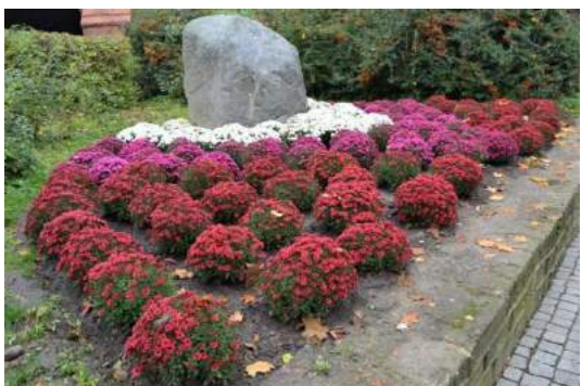
Fot. nr 12. Kwietnik przy Bramie Świętojańskiej – - odłona jesienna.