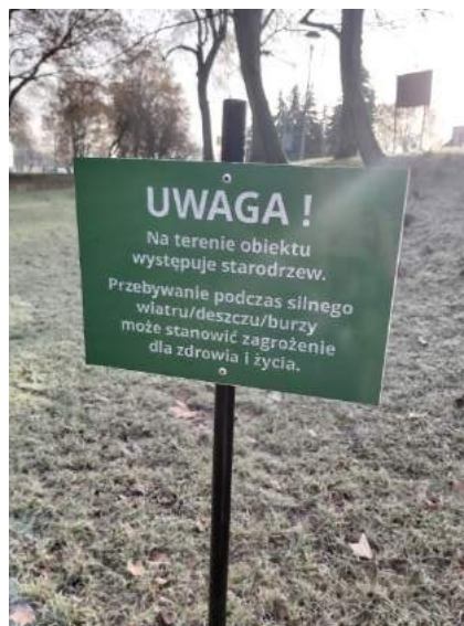
Fot. nr 17. Tabliczki ostrzegawcze