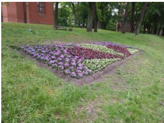
Fot. nr 10. Kwietnik przy ul. Czarnieckiego – lato.