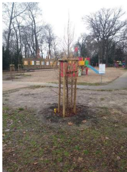
Fot. nr 6. Nowe nasadzenia drzew w parku Chrobrego