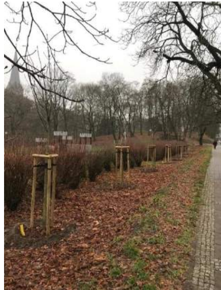
Fot. nr 5. Nowe nasadzenia drzew przy ul. Andrzeja Struga