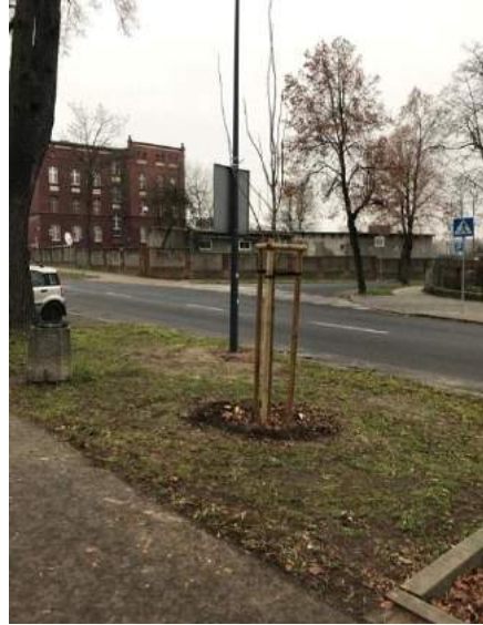
Fot. nr 4. Nowe nasadzenia drzew przy ul. 11 Listopada