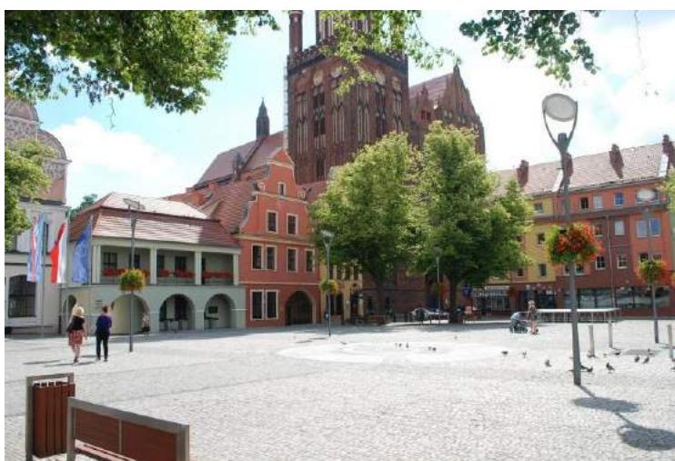
Fot. nr 14. Ukwiecenie ulic – ample na latarniach

Na słupach oświetlenia ulicznego w centrum miasta i na Starym Mieście zawieszono ponad 50 donic wiszących. Donice obsadzone pelargoniami i wilcem, które zdobiły ulice do jesiennych przymrozków.