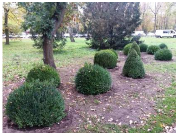
Fot. nr 16. Nasadzenia topiarów w parku im. Stefana Batorego