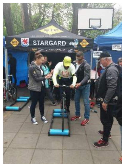
Fot. nr. 17 Green week 2018: Eco Run Stargard