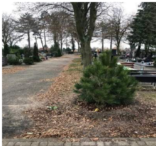
Fot. nr 7. Nowe nasadzenia drzew na Cmentarzu Komunalnym przy ul. Kościuszki