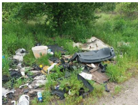
Fot. nr 1. Dzikie wysypisko zlokalizowane na terenie wzdłuż torów kolejowych przy ul. Składowej