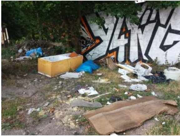
Fot. nr 2. Dzikie wysypisko zlokalizowane na terenie „drogi czołgowej” przy ul. Kościuszki