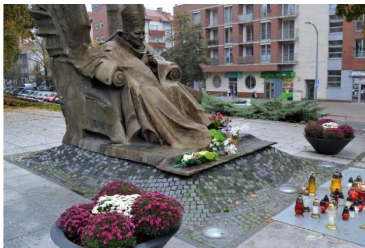
Fot. nr 15. Donice na skwerze Ojca Świętego Papieża Jana Pawła II – zmiana jesienna

W parku Bolesława Chrobrego, w rejonie teatru letniego ZUK obsadza lawendą donice kupione i wystawiane w sezonie letnim przez SCK Sp. z o.o.