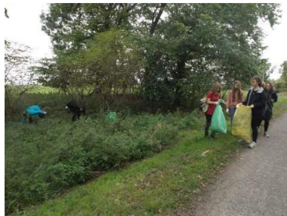
Fot. nr 18 Zdjęcia z przeprowadzonej akcji „Sprzątanie Świata – Polska 2019”