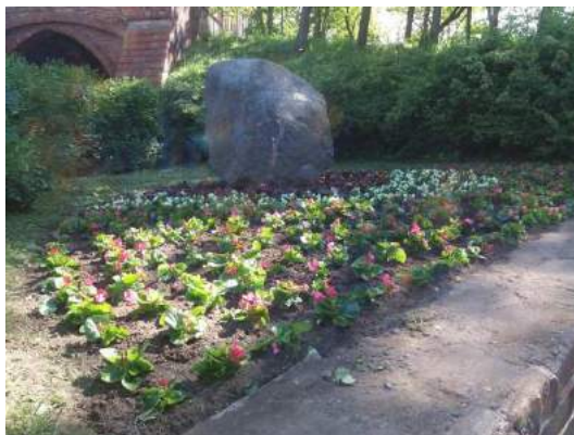
Fot. nr 11. Kwietniki przy Bramie Świętojańskiej - lato