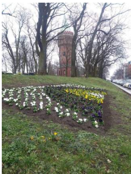
Fot. nr 8. Kwietnik przy ul. Czarnieckiego – wiosna.