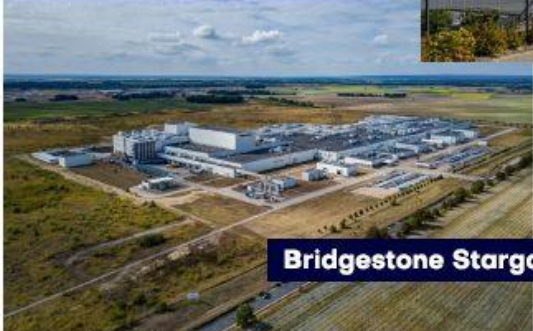
Bridgestone Stargard Sp. z o.o.