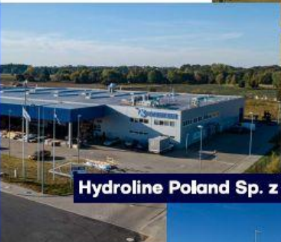
Hydroline Poland Sp. z o.o.