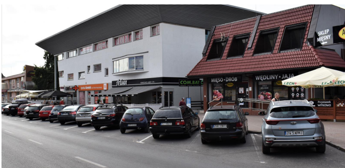
ul. S. Wyszńskiego – po stronie Agrofirmy Witkowo