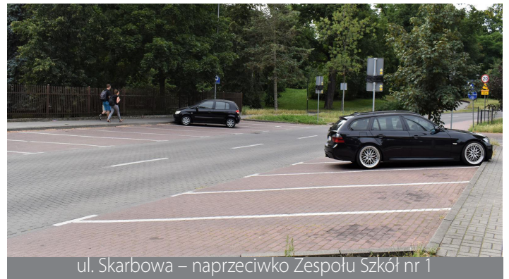
ul. Skarbowa – naprzeciwko Zespołu Szkół nr 1