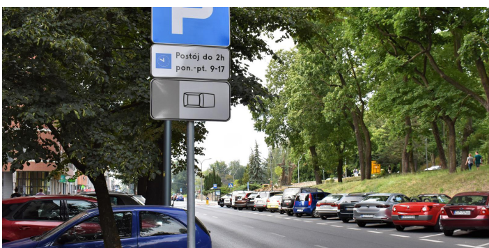
ul. S. Czarnieckiego – po stronie Urzędu Miejskiego