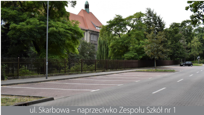
ul. Skarbowa – naprzeciwko Zespołu Szkół nr 1