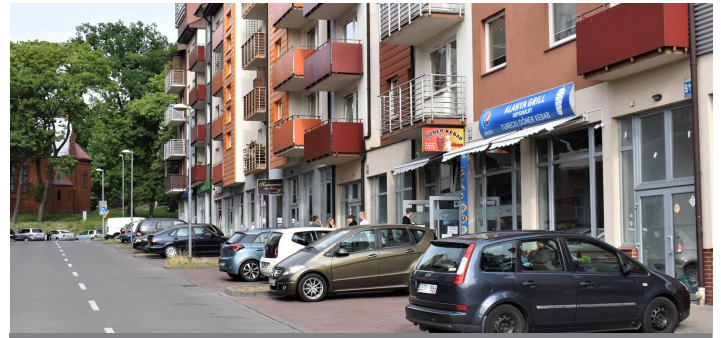
ul. Skarbowa – po stronie sklepu monopolowego, kwiatarni i kebabu (budynek ul. S. Czarnieckiego 9)