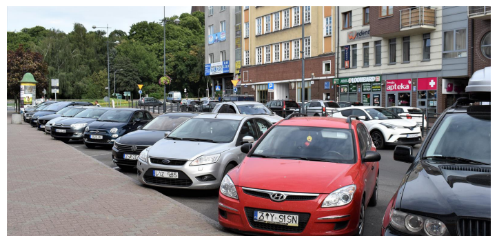
ul. S. Wyszńskiego – po stronie Agrofirmy Witkowo