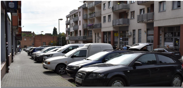
ul. Skarbowa – po stronie sklepu monopolowego, kwiatarni i kebabu (budynek ul. S. Czarnieckiego 9)