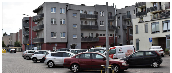
parking za Centrum Handlowym Rondo