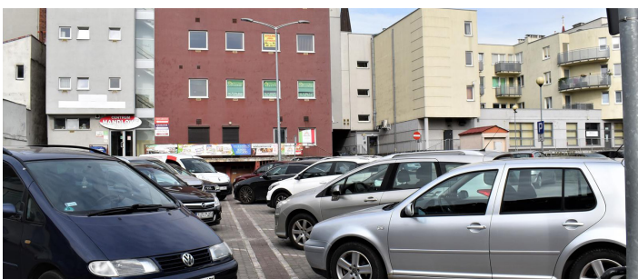
parking za Centrum Handlowym Rondo