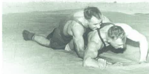
1936-11-04 - 1936-11-05 - Poznań