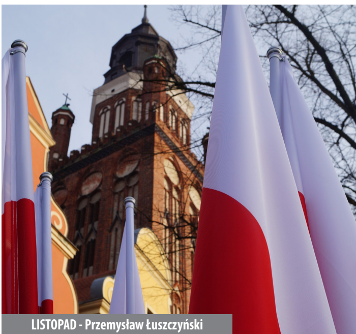
LISTOPAD - Przemysław Łuszczynski