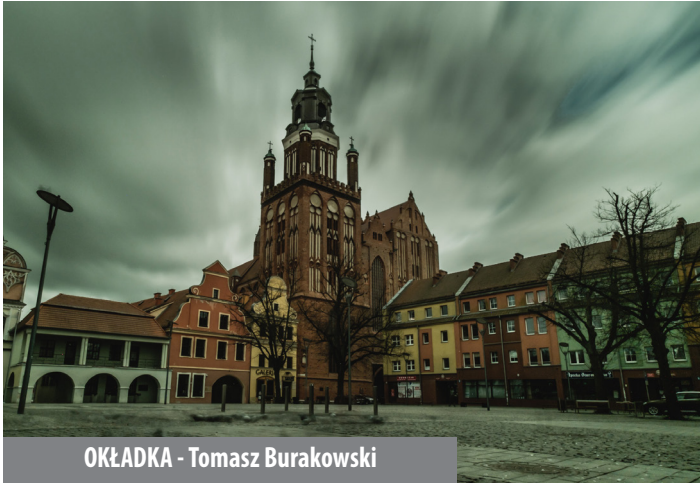
OKŁADKA - Tomasz Burakowski