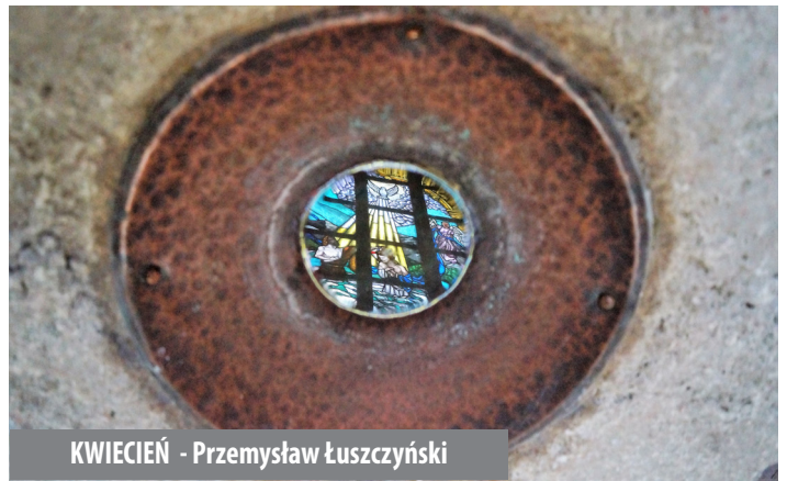
KWIECIEŃ - Przemysław Łuszczynski