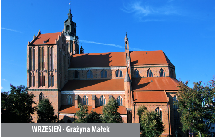
WRZESIEŃ - Grażyna Małek