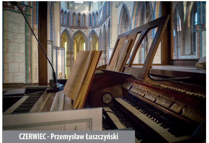
CZERWIEC - Przemysław Łuszczynski